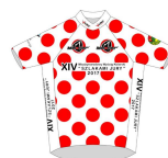
SPONSOR KOSZULKI KLASYFIKACJI GÓRSKIEJ