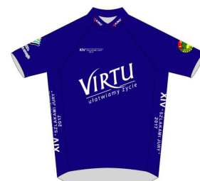
SPONSOR KOSZULKI KLASYFIKACJI PUNKTOWEJ